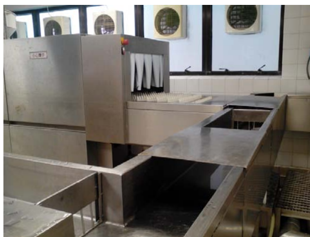
(1)先處理從醫院收集到的廚餘