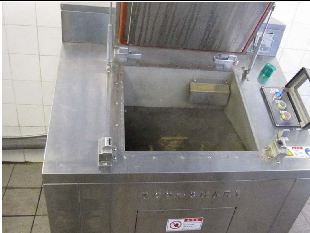
(2)利用「廚餘機」將廚餘轉化為有機肥料