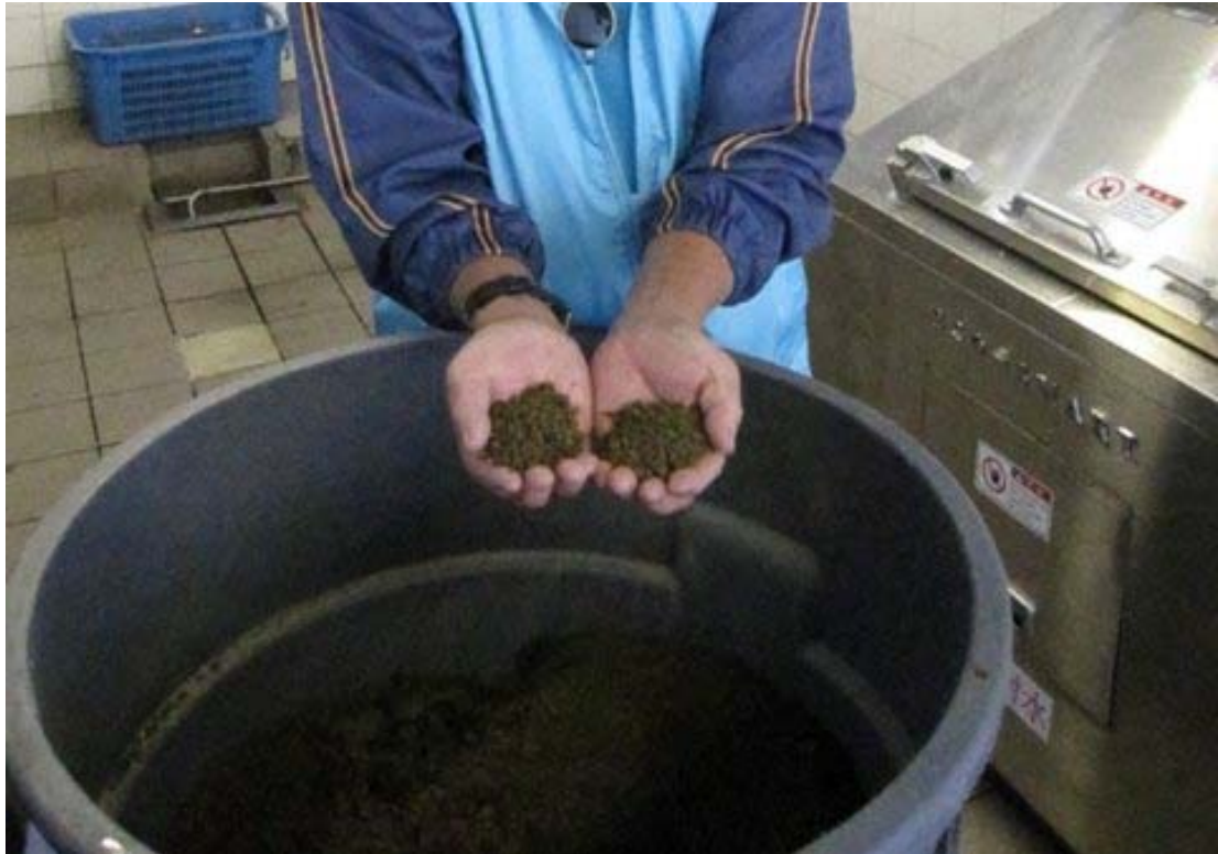
(3) 兩部「廚餘機」每天能處理 100 公斤的廚餘，並將之轉化為 10 公斤的有機肥料