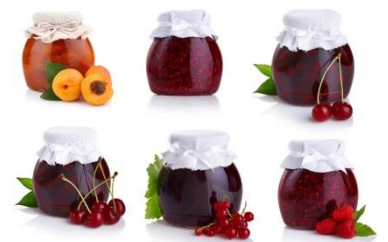
利用剩餘生果作果醬