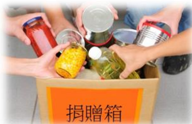
把剩餘可食用的食物 捐贈予有需要人士